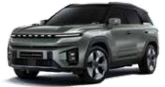
포레스트 그린 2GO

* 투톤 : 루프 / 스포일러 / C필러 : 블랙 컬러 * 투톤 선택 시 세이프티 선루프, 실버 컬러 C필러 가니쉬 선택 불가 * 본 가격표에 수록된 제품의 색상은 인쇄된 것이므로 실제 색상과 다소 차이가 있을 수 있습니다.