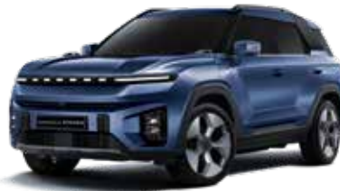
덴디 블루 BAS