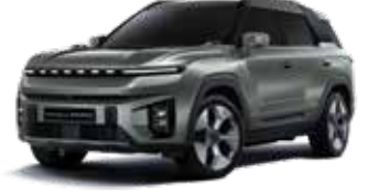
포레스트 그린 GAO