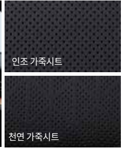
블랙 인테리어 (블랙 헤드라이닝)