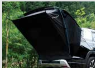
차박용 텐트 380,000원