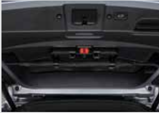
멀티 우산꽂이(우산꽂이 + 비상등 + 테일게이트 스팟램프) 150,000원