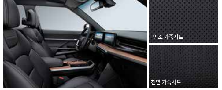
블랙 인테리어 (블랙 헤드라이닝)