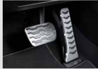
스포츠 페달 40,000원