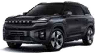
스페이스 블랙 LAK