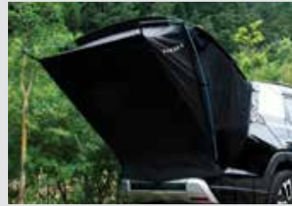
차박용 텐트 380,000원