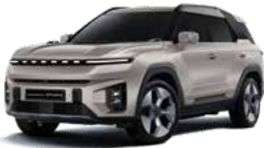
라떼 그레이지 EBL