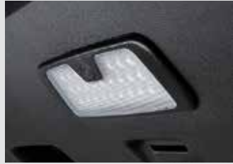
테일게이트 LED 램프 120,000원