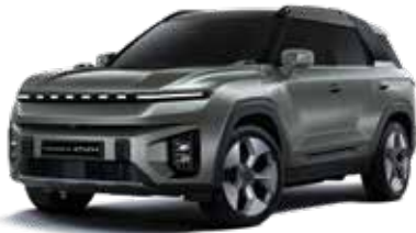
포레스트 그린 GAO