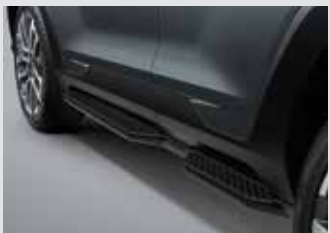
사이드 스텝(좌/우) 450,000원