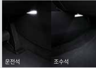
1열 풋램프 & LED 글로브 박스 램프 50,000원