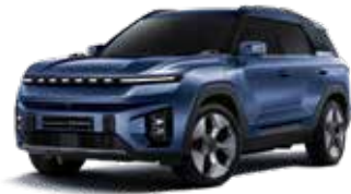
맨디 블루 BAS