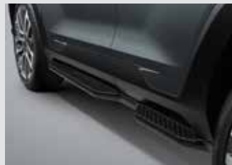
사이드 스텝(좌/우) 450,000원

* 상기 품목은 취급 설명서 내 커스터마이징 품목 보증서에 따라 보증 적용됩니다.