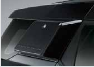
사이드 스토리지 박스(블랙) 300,000원