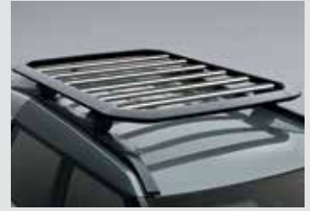
루프 플랫폼 캐리어 800,000원