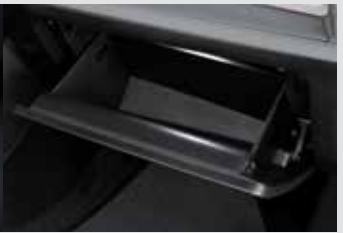
1열 풋램프 & LED 글로브 박스 램프 50,000원