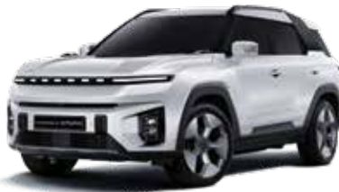
그랜드 화이트 WAA