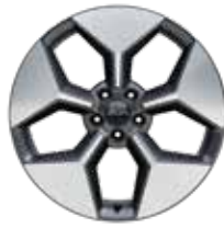
20인치 다이아몬드 커팅 휠