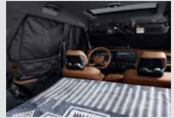
멀티 커튼 100,000원