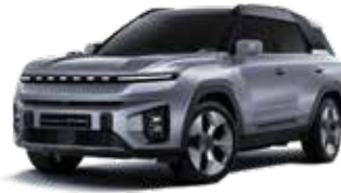
아이언 메탈 ADE