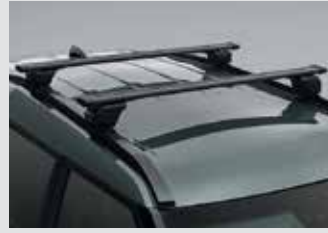
루프 크로스바 450,000원