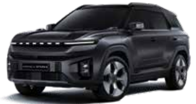
스페이스 블랙 LAK

* 원톤 : 루프 / 스포일러 : 바디컬러, C필러 : 블랙 컬러 * 본 가격표에 수록된 제품의 색상은 인쇄된 것이므로 실제 색상과 다소 차이가 있을 수 있습니다.