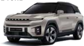
라메 그레이지 2BL