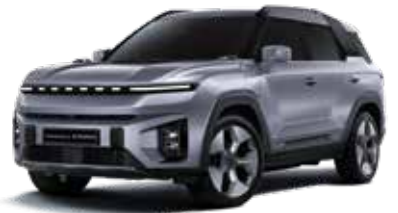
아이언 메탈 ADE