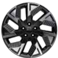
18인치 다이아몬드 컷팅 휠