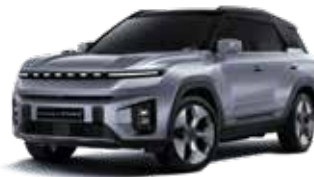
아이언 메탈 2DE