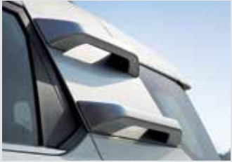
루프 클라이밍 핸들(블랙 기본/실버 옵션) 300,000원