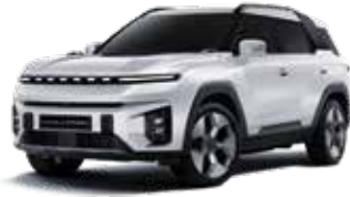
그랜드 화이트 WAA