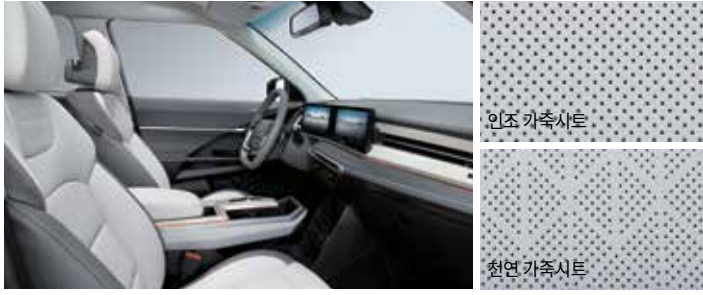
그레이 인테리어 (그레이 헤드라이닝)