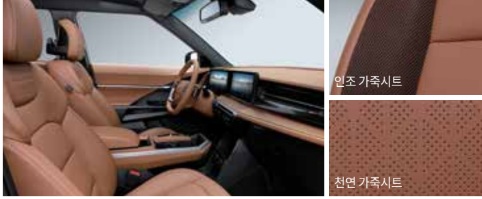
브라운 인테리어 (블랙 헤드라이닝)