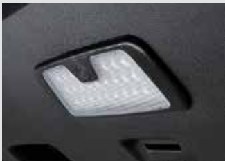
테일게이트 LED 램프 120,000원