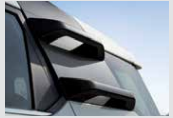
루프 클라이밍 핸들(블랙) 300,000원