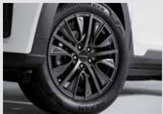
18인치 단조휠 2,480,000원