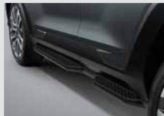
사이드 스텝 (좌/우) 450,000원

* 상기 품목은 취급 설명서 내 커스터마이징 품목 보증서에 따라 보증 적용됩니다.