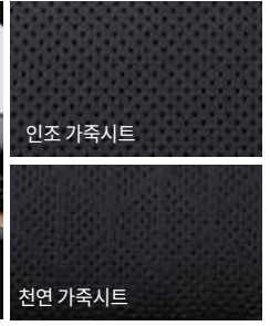
블랙 인테리어 (블랙 헤드라이닝)