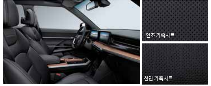
블랙 인테리어 (블랙 헤드라이닝)