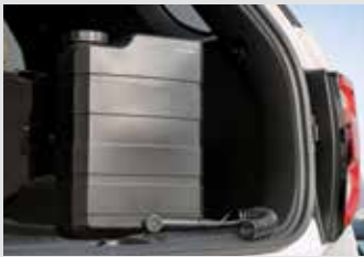
리어 패키지 (아웃도어 워터탱크/휴대용 멀티 에어 컴프레서) 280,000원