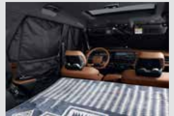
멀티 커튼 100,000원