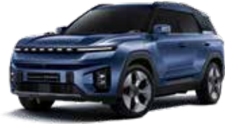
맨디 블루 BAS