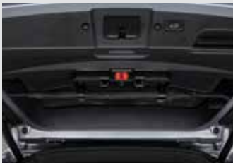
멀티 우산꽂이(우산꽂이 + 비상등 + 테일게이트 스팟램프) 150,000원