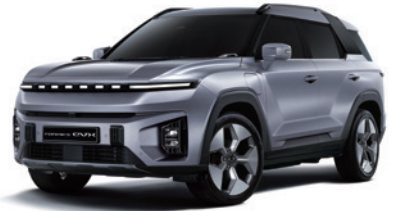
아이언 메탈 ADE