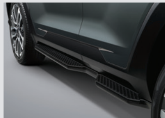
사이드 스텝(좌/우) 450,000원

* 상기 품목은 취급 설명서 내 커스터마이징 품목 보증서에 따라 보증 적용됩니다.