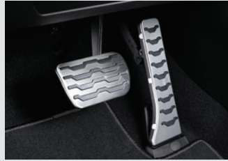
스포츠 페달 40,000원