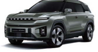
포레스트 그린 GAO