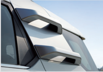
루프 클라이밍 핸들(블랙 기본/실버 옵션) 300,000원