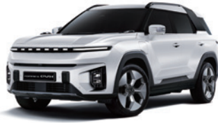
그랜드 화이트 WAA