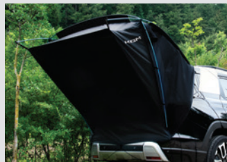
차박용 텐트 380,000원