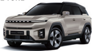
라메 그레이지 2BL