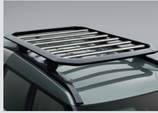
루프 플랫폼 캐리어 800,000원