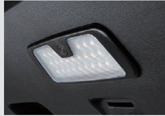
테일게이트 LED 램프 120,000원