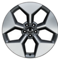
20인치 다이아몬드 커팅 휠