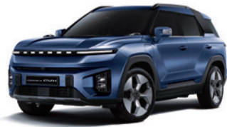
맨디 블루 BAS