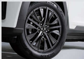
18인치 단조휠 2,480,000원