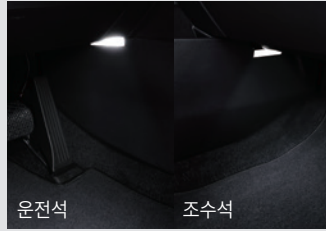
1열 풋램프 & LED 글로브 박스 램프 50,000원