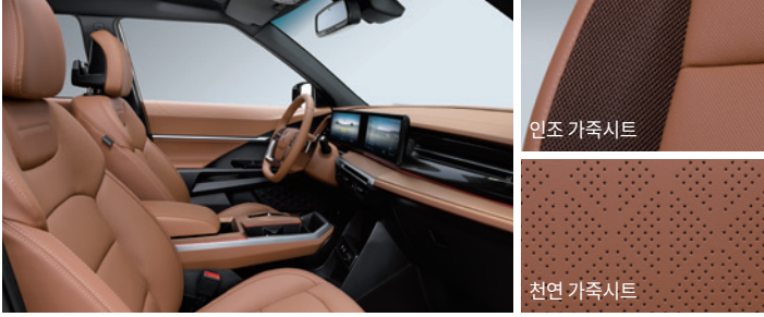
브라운 인테리어 (블랙 헤드라이닝)