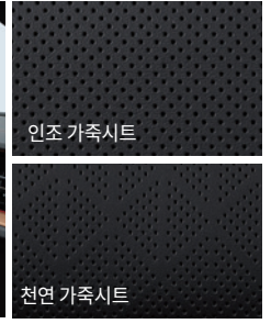
블랙 인테리어 (블랙 헤드라이닝)