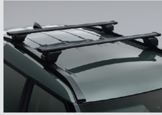
루프 플랫폼 캐리어 800,000원