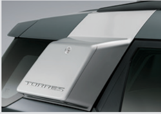
사이드 스토리지 박스(블랙 기본/실버 옵션) 300,000원