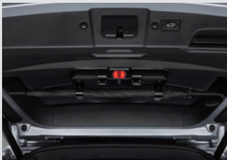
멀티 우산꽃이(우산꽃이 + 비상등 + 테일게이트 스팟램프) 150,000원