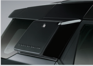
사이드 스토리지 박스(블랙) 300,000원