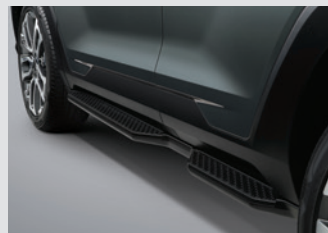
사이드 스텝 (좌/우) 450,000원