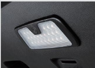
테일게이트 LED 램프 120,000원