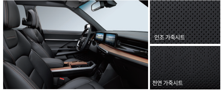
블랙 인테리어 (블랙 헤드라이닝)