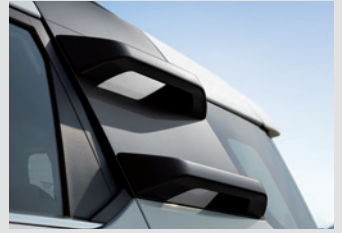
루프 클라이밍 핸들(블랙) 300,000원