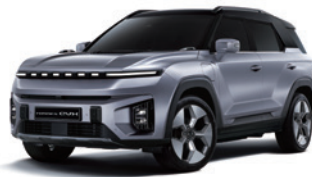
아이언 메탈 2DE