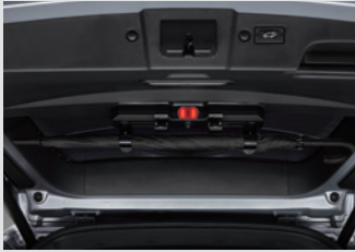
멀티 우산꽂이(우산꽂이 + 비상등 + 테일게이트 스팟램프) 150,000원