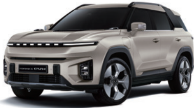
라메 그레이지 EBL