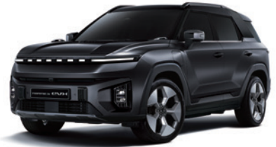
스페이스 블랙 LAK

* 원톤 : 루프 / 스포일러 : 바디컬러, C필러 : 블랙 컬러 * 본 가격표에 수록된 제품의 색상은 인쇄된 것이므로 실제 색상과 다소 차이가 있을 수 있습니다.