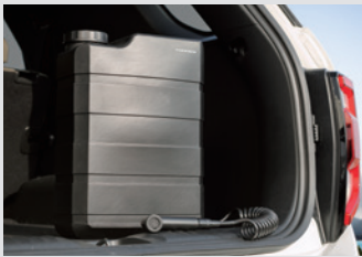
리어 패키지 (아웃도어 워터탱크/휴대용 멀티 에어 컴프레서) 280,000원