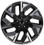
18인치 다이아몬드 커팅 휠