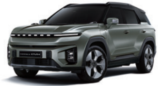
포레스트 그린 2GO

* 투톤 : 루프 / 스포일러 / C필러 : 블랙 컬러 * 투톤 선택 시 세이프티 선루프, 실버 컬러 C필러 가니쉬 선택 불가 * 본 가격표에 수록된 제품의 색상은 인쇄된 것이므로 실제 색상과 다소 차이가 있을 수 있습니다.