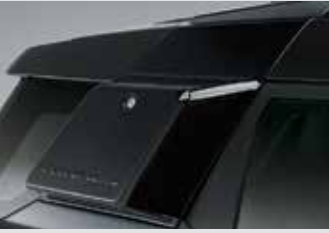
루프 크로스바 450,000원