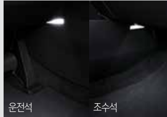
1열 풋램프 & LED 글로브 박스 램프 50,000원