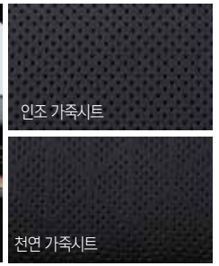
블랙 인테리어 (블랙 헤드라이닝)