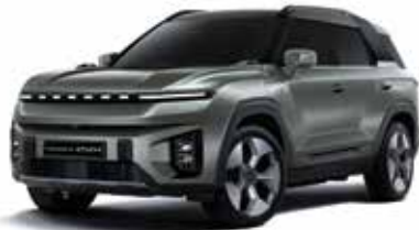
포레스트 그린 GAO