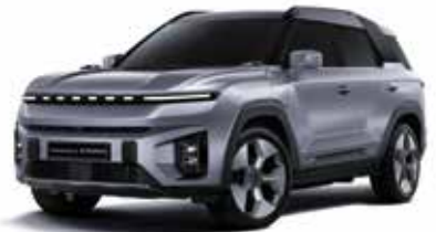
아이언 메탈 ADE