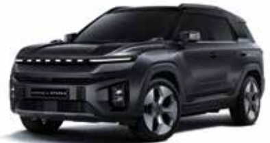
스페이스 블랙 LAK

* 원톤 : 루프 / 스포일러 : 바디컬러, C필러 : 블랙 컬러 * 본 가격표에 수록된 제품의 색상은 인쇄된 것이므로 실제 색상과 다소 차이가 있을 수 있습니다.