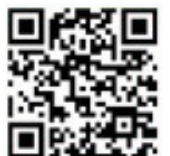
토레스 EVX VAN 모바일 페이지

18인치 : 복합 4.9km [도심주행 5.3km, 고속도로 4.5km] | 1회 충전거리 - 복합 411km [도심주행 439km, 고속도로 376km] | 공차중량 : 1,960kg | 축전지 정격전압 : 390V | 용량 : 189Ah 20인치 : 복합 4.8km [도심주행 5.2km, 고속도로 4.4km] | 1회 충전거리 - 복합 400km [도심주행 430km, 고속도로 364km] | 공차중량 : 1,960kg | 축전지 정격전압 : 390V | 용량 : 189Ah 최고출력 152.2kW(207ps) 최대토크 34.6kgf·m