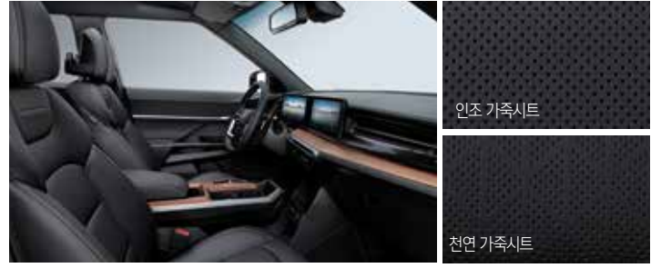
블랙 인테리어 (블랙 헤드라이닝)