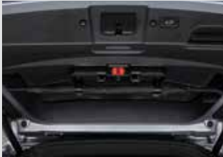
멀티 우산꽂이(우산꽂이 + 비상등 + 테일게이트 스팟램프) 150,000원