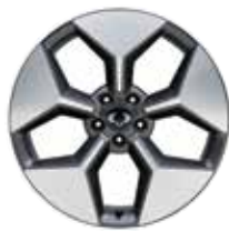
20인치 다이아몬드 커팅 휠