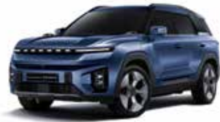
만디 블루 BAS