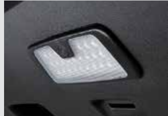
테일게이트 LED 램프 120,000원