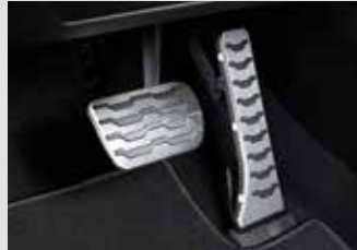
스포츠 페달 40,000원