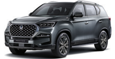
엘리멘탈 그레이 ACY