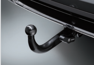
트레일러 히치 13핀(BRiNK) 1,200,000원