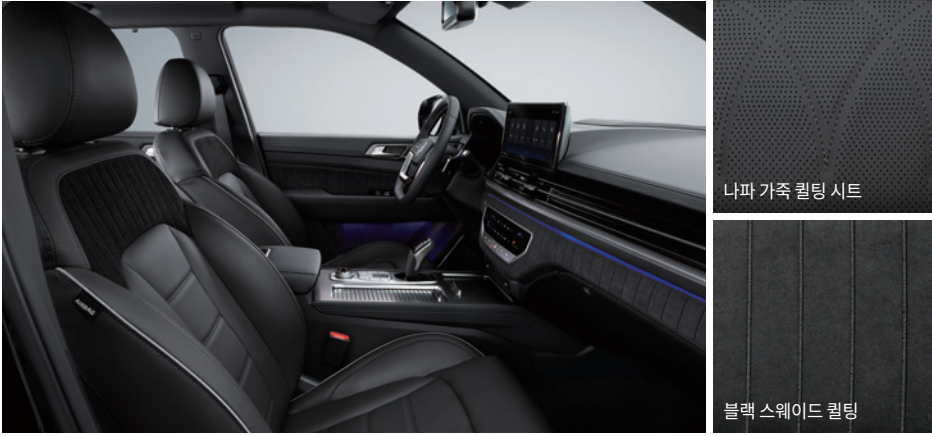
블랙 인테리어 (블랙 헤드라이닝)