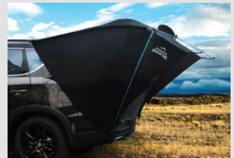
차박용 텐트 380,000원