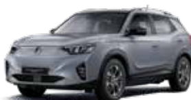
아이언 메탈 ADE