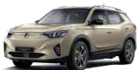
라메 그레이지 EBL