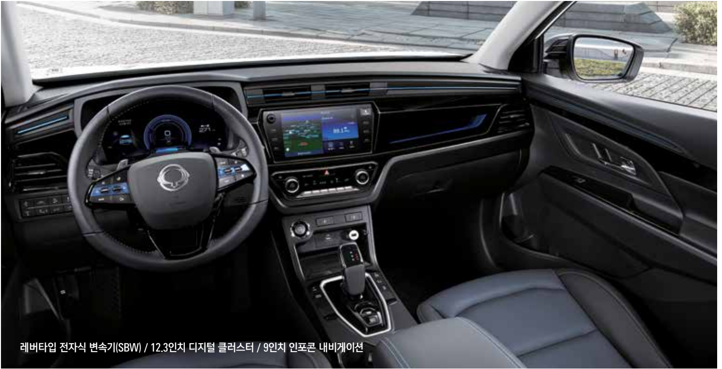
레버타입 전자식 변속기(SBW) / 12.3인치 디지털 클러스터 / 9인치 인포콘 내비게이션