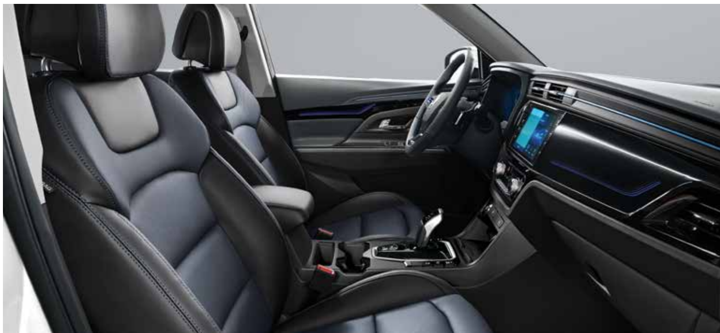
블루 포인트 블랙 인테리어(그레이 헤드라이닝)