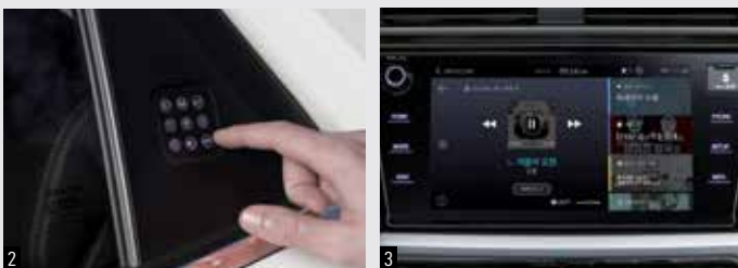
1. 최첨단 자율주행 보조 시스템(IACC) 2. 스마트 터치 패널(STPM) 3. 커넥티드카 서비스(인포콘)

편리한 스마트 터치 패널과 첨단 자율주행 보조 시스템을 더하여 더 짜릿하게 즐기는 드라이빙 테크놀로지! 국내 EV중 가장 경제적인 전기차로 새롭게 시작하는 사회초년생의 첫 전기SUV가 코란도 EV이어야 하는 이유입니다.