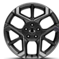
18인치 다이아몬드 커팅 휠(225/60R18 타이어)