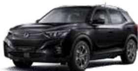
스페이스 블랙 LAK