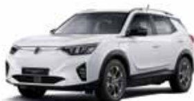
그랜드 화이트 WAA