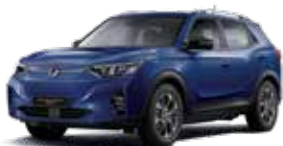
만디 블루 BAS