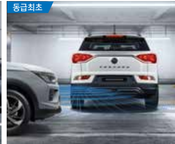
동급최초 후측방 접근 충돌 방지 보조 (RCTAI)