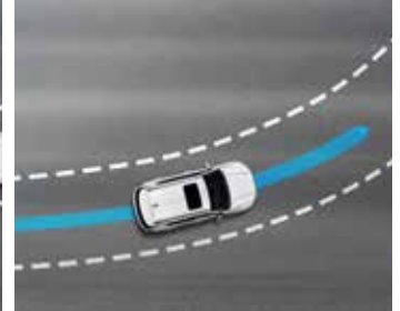
차선 중심 추종 제어(LCFA)