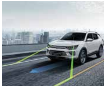
차선 유지보조 시스템 (LKAS) 차선 이탈경보 시스템 (LDWS)