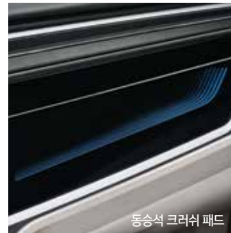
동승석 크래쉬 패드

스마트폰과 AVN 그리고 클러스터가 동시에 연동되어 스마트폰 앱을 차 안에서도 즐길 수 있으며 편리한 운전이 가능합니다. (와이파이 양방향 풀 미러링, 안드로이드 오토, 애플 카플레이)