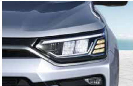
Full LED 헤드램프 (LED DRL, LED 방향지시등, LED 로우빔/하이빔)