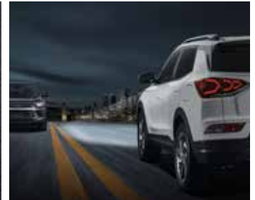
스마트 하이빔 (HBA)