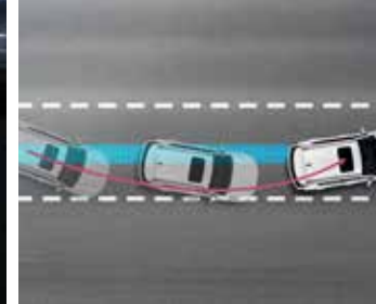
횡방향 제어 컨셉