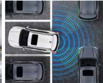
후측방 접근 경보 (RCTA)