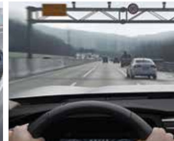
고속도로 안전속도 제어 (NICC)