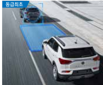
동급최초 안전거리 경보 (SDA)