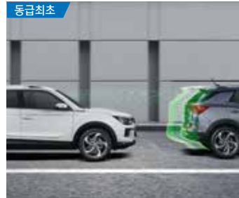
동급최초 앞차 출발 알림 (FVSA)