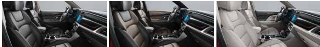
차를 블랙 인테리어 에스프레소 브라운 인테리어 소프트 그레이 인테리어