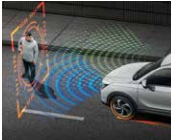
긴급 제동보조 시스템 (AEBS) 전방 충돌경보 시스템 (FCWS)