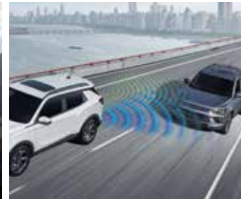
차선변경 경보 시스템 (LCA)