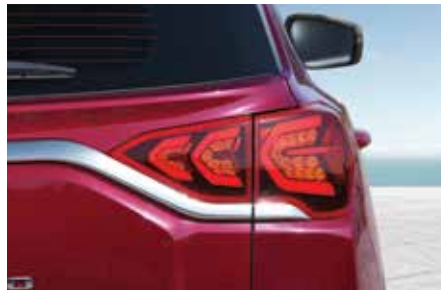
LED 리어 콤비램프 (LED 제동등, LED 미등)