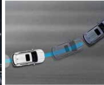
선행차량 추종 제어

IACC(Intelligent Adaptive Cruise Control) 고성능 레이더와 카메라가 전방 차량을 감지하여 전방 차량과의 차속을 일정하게 유지합니다. 특히, 고속도로는 물론 일반도로에서도 차선 중심 추종 제어를 할 수 있습니다.