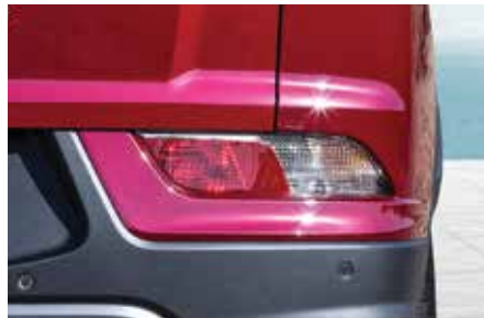
보조램프 (리플렉스 리플렉터, 후진등, 방향지시등)