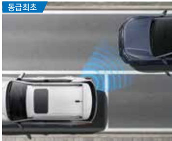
동급최초 탑승객 하차 보조 (EAF)