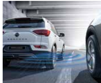
사각지대 감지 시스템 (BSD)