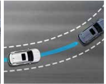
차선 내 선행차량 추종 제어