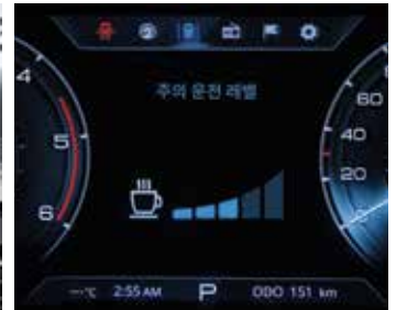
부주의 운전경보 시스템 (DAA)