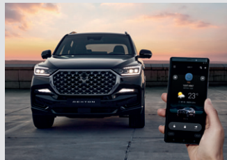
디지털 스마트 키 320,000원