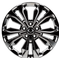
뉴 디자인 20인치 슈퍼링 휠