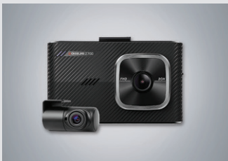
아이나비 블랙박스(16GB) 220,000원