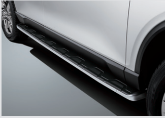
고장식 사이드 스텝 360,000원