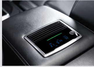
블트인 공기청정기 370,000원