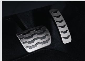
스포츠 페달 40,000원