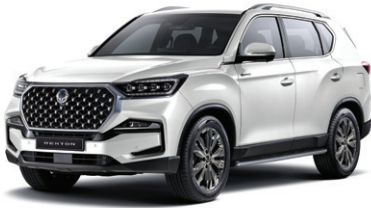
그랜드 화이트 WAA