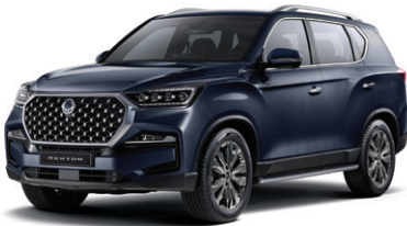
아틀란틱 블루 BAU

* 실키 화이트 펄 익스테리어 컬러는 노블레스 트림과 더 블랙 트림에서 선택 가능 * 본 가격표에 수록된 제품의 색상은 인쇄된 것이므로 실제 색상과 다소 차이가 있을 수 있습니다.