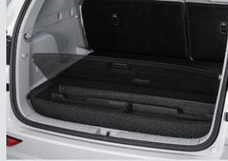
러기지 트레이(5인승 전용) 70,000원