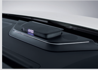
플로팅 센터 스피커 390,000원