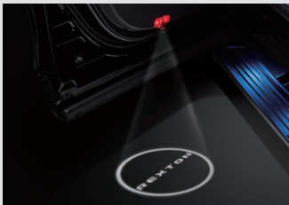
도어 스팟램프 110,000원