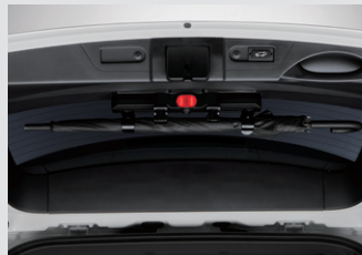
멀티 우산꽃이(우산꽃이 + 비상등 + 테일게이트 스팟램프) 150,000원