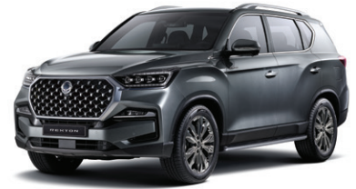
엘리멘탈 그레이 ACY