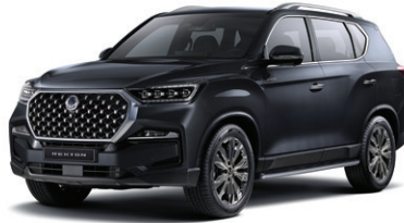
갤럭시스 그레이 ADB