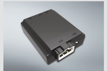
에어컨 습기 건조기 160,000원