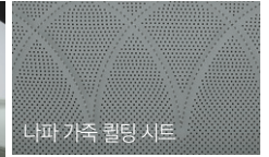
카키 인테리어 (블랙 헤드라이닝)