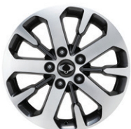
18인치 다이아몬드 커팅 휠