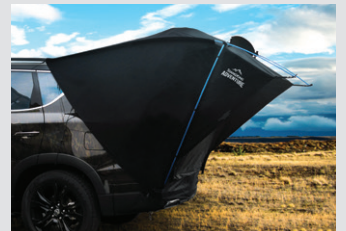
차박용 텐트 380,000원