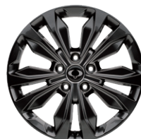
뉴 디자인 20인치 다크 슈퍼링 휠