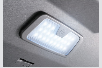
테일게이트 LED 램프 120,000원