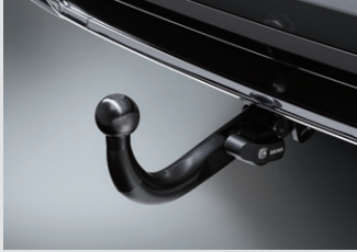
트레일러 히치 13핀(BRINK) 1,200,000원